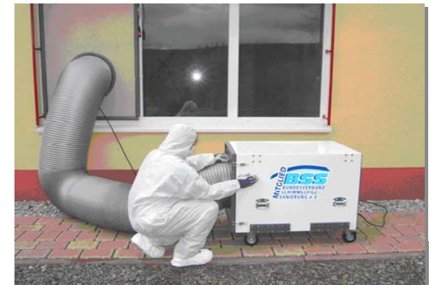
Abb.: Ausrüstung zur Absaugung von Luft mit Unterdruck