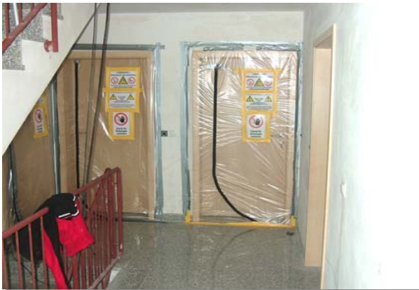
Abb.: Abschottung gegenüber unbelasteten Bereichen

Eine Desinfektion kann eine fachgerechte Schimmelpilzsanierung keinesfalls ersetzen!